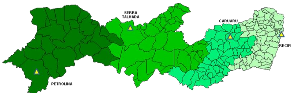
Figura 1: Macrorregiões de Saúde do Estado de Pernambuco.