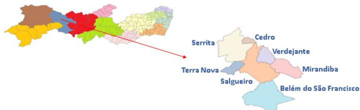
Figura 3: Localização Geográfica da VII Região de Saúde no Estado de Pernambuco.